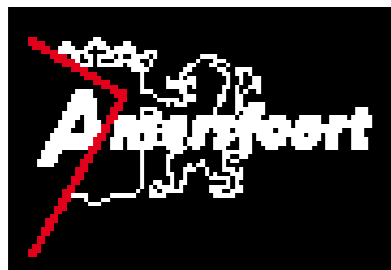
Logo diapositief kleur Het logo mag nooit in een (zwart) blok getoond. Gebruik de losse uitsnede!

Over Infographics komt een aanvulling gebaseerd op het enthousiasme van collega's. Een infographic moet functioneel zijn, het is het weergeven van complexe informatie in een heldere illustratie of schema. In de praktijk komt dat neer op (grafisch) ontwerp voor gevorderden! De aanvulling komt met hulp van diegene die er mee aan de slag gingen. Er is weinig beperking in huisstijl. Bedenk wel dat lang niet iedere infographic mensen helpt de informatie beter te begrijpen. Beoordeel daarop. Maak waar mogelijk gebruik van de voor de situatie geldende fonts en kleuren.