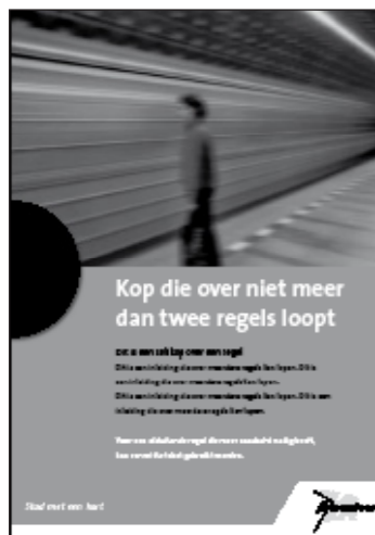
Dit is de zwart-wit weergave. Deze bestond al langer maar wordt opnieuw onder de aandacht gebracht omdat het een duurzame variant is d.w.z. minder schadelijk voor het milieu dan kleur.

Stramienen van A4 tot A0 zijn bij de Repro in eps. beschikbaar Voor een liggende opmaak (landscape) zijn geen stramienen, maar het principe van de opmaak is hetzelfde als die van deze staande (portrait) voorbeelden!