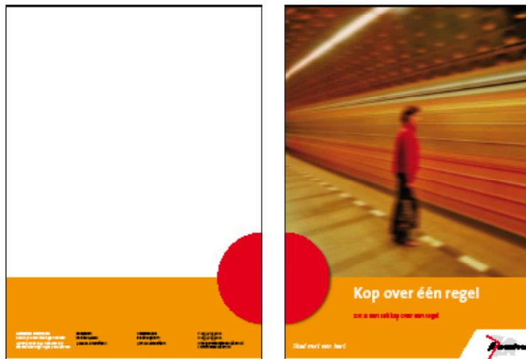
Voorbeeld opbouw achter- en voorzijde van een uiting met 25% kleurbalk.