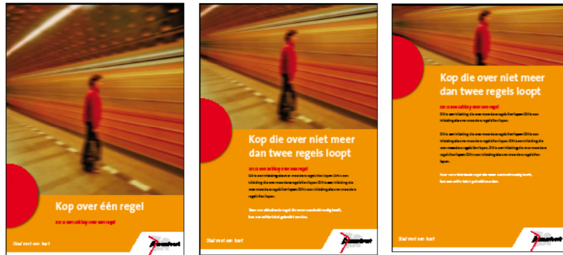
De oranje balk mag 25%, 50% of 75% van de hoogte in beslag nemen.