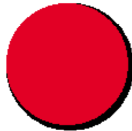
cirkel met schaduw