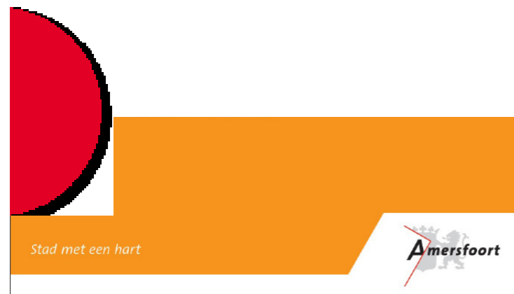
De cirkel wordt altijd op deze manier gekoppeld aan de kleurbalk.