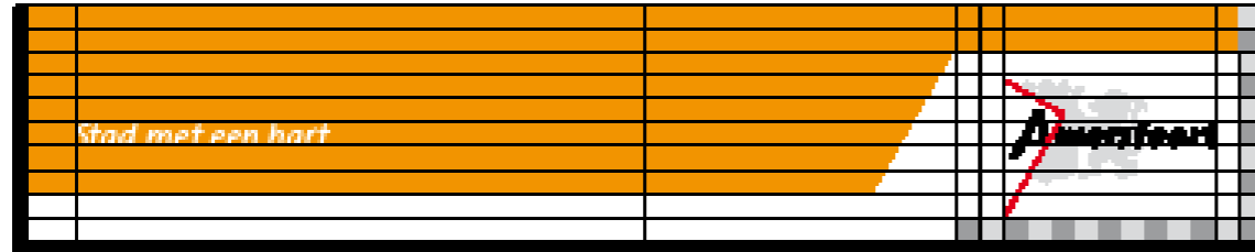
Kleurbalk met pay-off en logo. De balk heeft altijd de witte onderregel/tab.