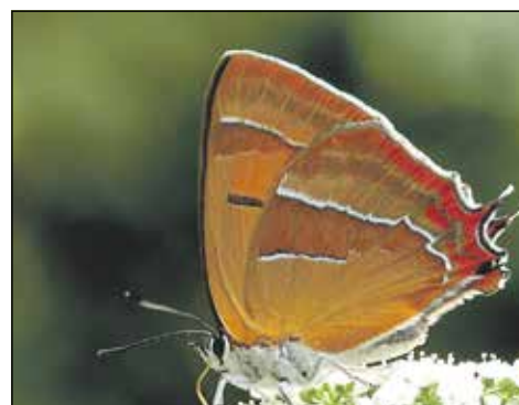
De Sleedoornpage

In totaal zijn 7 eitjes gevonden. Later zijn ook nog drie eitjes gemeld van een andere locatie. De sleedoornpage vliegt van eind juli tot eind september. Hij komt voor in sleedoornstruiken, houtwallen en bosranden. De laatste jaren lijkt het leefgebied steeds meer te verschuiven naar tuinen en parken in steden en dorpen. Het voedsel bestaat uit honingdauw en nectar.