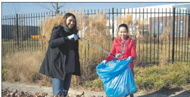
(Foto: teamleden van Applied Medical ruimen afval op tijdens hun wandeling in de lunchpauze.)

Het bedrijf Applied Medical ontwerpt, ontwikkelt, produceert en distribueert medische instrumenten voor meer dan 75 landen, vanuit Californië (U.S.A) en een Europees hoofdkantoor in Amersfoort. De medewerkers van het bedrijf zetten zich actief in voor duurzaamheid.