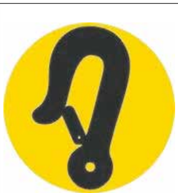
Dit is het symbool van de haak dat staat voor veilig vervoer rolstoelgebruikers

Als uw rolstoel geen sticker heeft of als u daaraan twijfelt, neem dan contact op met de leverancier van uw rolstoel. Als u een rolstoel via de gemeente heeft, is dit Meyra of Medipoint. Waarschijnlijk heeft uw rolstoel dan al een sticker. Zo niet, meld uw leverancier dan dat uw rolstoel mogelijk niet aan de code VVR voldoet. De leverancier zoekt samen met u naar een oplossing.