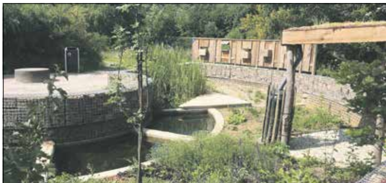
Een voorbeeld van een klimaatbestendige tuin

Meer info over de klimaatbestendige voorbeeldtuinen: https://www.lekkerinjetuin.nl/voorbeeldtuinen-groenehuis/