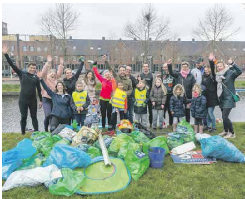
Tijdens World Cleanup Day wordt in heel Amersfoort zwerfafval opgeruimd.

Op zaterdag 21 september 2019 is het World Cleanup Day. Miljoenen mensen wereldwijd werken deze dag aan een schonere wereld! Een golf van schoonmaakacties die begint in Nieuw-Zeeland en 36 uur later eindigt op Hawaii. In Amersfoort gaan honderden vrijwilligers die zaterdag aan de slag om de stad zwerfafvalvrij te maken. Gewapend met afvalknijper en vuilniszak strijden ze tegen rondslingerend plastic, lege blikjes en andere rommel. Het initiatief is inmiddels uitgegroeid tot een stadsbrede actie met diverse startlocaties in de hele stad. En iedereen die wil kan hieraan meedoen.