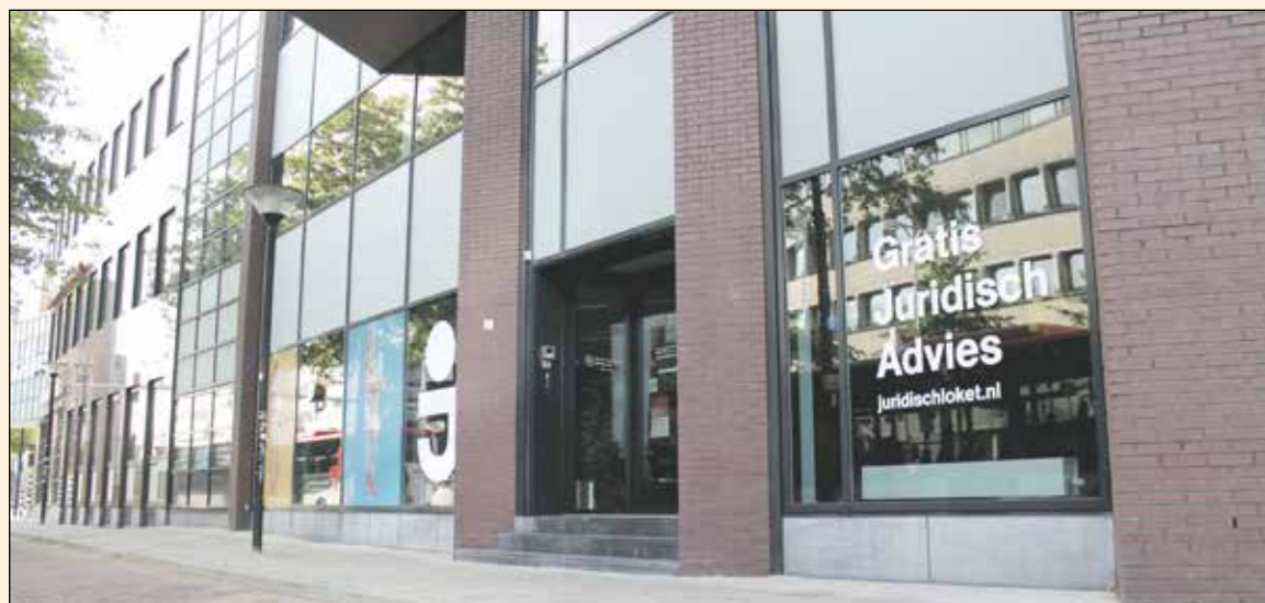
Het Juridisch Loket, Van Asch van Wijckstraat 2.

Ook bij Geldloket Amersfoort kunt u het hele jaar door gratis terecht met vragen over geldzaken. Kijk voor meer informatie op www.geldloket.nl .