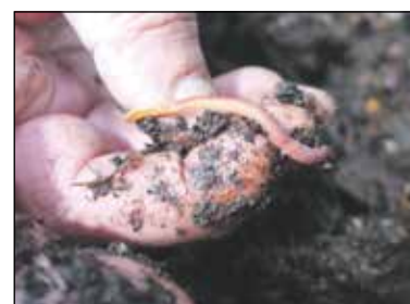
Wormen maken van keukenafval vermicompost

Vrijdag 27 september (15.00 uur) is de publieksopening van de StadsWormerij. Kom wormen knuffelen, drink een kop Darboven-koffie (of thee) en krijg tips over hoe zelf thuis te vermicomposteren. De StadsWormerij is te vinden in de Keistadloods / circulaire pleisterplaats Vinkenhoef (Oude Lageweg 66).