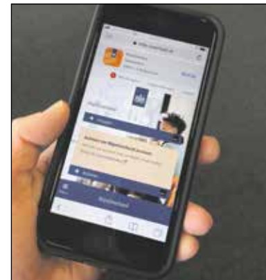
De handige App Berichtenbox

En wist u dat u ook de handige app Berichtenbox kunt downloaden? Met deze app kunt u op uw smartphone post lezen en een melding ontvangen bij nieuwe post. Zo mist u nooit berichten van de overheid.