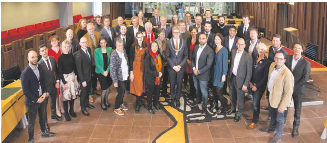
De gemeenteraad van Amersfoort.

Bij dit onderwerp kunt u gebruikmaken van het zogeheten