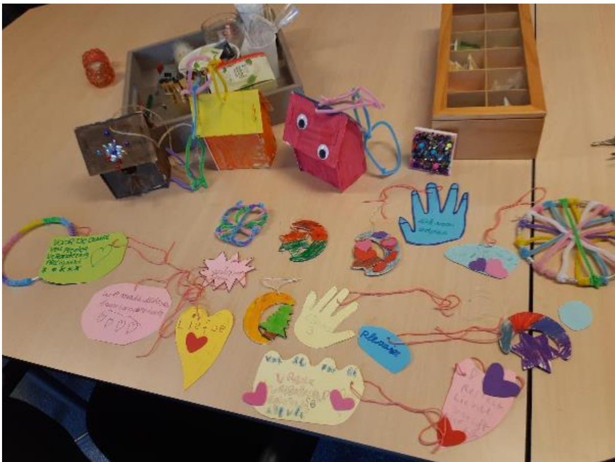
Figuur 6 wensen voor de buurt gemaakt door kinderen uit Juliana van Stolbergbuurt

Een toelichting op deze prioriteiten en de bijbehorende activiteiten en het gewenste resultaat vindt u terug in dit hoofdstuk.