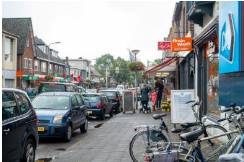
Figuur 2 Leusderweg

Het Leusderkwartier is een wijk die voor het grootste deel voor de Tweede Wereldoorlog werd gebouwd. Begin twintigste eeuw werden er huizen gebouwd in de zogenaamde 'Driehoek' tussen de Leusderweg en de huidige Kersenbaan. In de Driehoek staan relatief veel kleinere arbeiderswoningen. Later breidde de wijk zich richting het zuiden uit met karakteristieke jaren '30-woningen en meer ruimte en groen. Na de Tweede Wereldoorlog zijn nog diverse portiekflats gebouwd. De