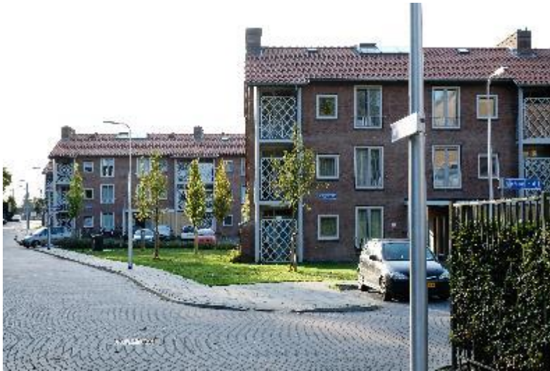
Figuur 4 De Ganskuijl

Het Vermeerkwartier ligt aan het Park Randenbroek. Het grootste deel van de woningen is gebouwd in de jaren 20 en 30. De woningen aan de zuidelijke kant van de Gasthuislaan zijn na de Tweede Wereldoorlog gebouwd. Aan De Ganskuijl zijn de woningen recent gerenoveerd.