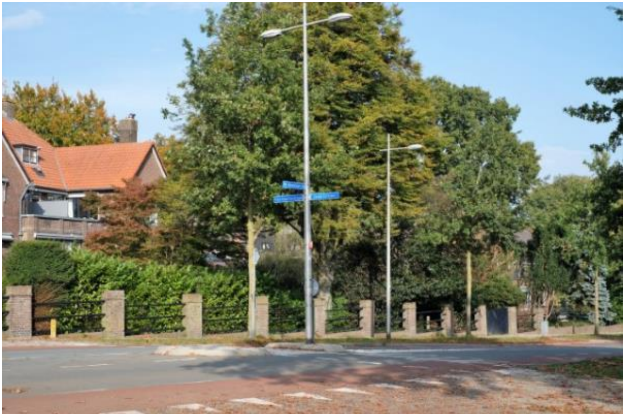
Figuur 5 kruispunt Bergkwartier

Verder is in het Bergkwartier-Bosgebied 25% mantelzorger, tegenover 15% gemiddeld in Amersfoort. Dit komt waarschijnlijk door de relatief oude bevolking, waarbij partners voor elkaar zorgen. Het aandeel inwoners dat gebruik maakt van de Wet Maatschappelijke Ondersteuning (WMO) is echter niet hoger dan in veel andere wijken. Onder de WMO vallen o.a. zaken als huishoudelijke hulp en dagbesteding, waar oudere bewoners vaker voor in aanmerking komen. Vanwege de toenemende vergrijzing en een beleidswijziging (abonnementstarief) kan worden verwacht dat het gebruik van de WMO hier zal toenemen.