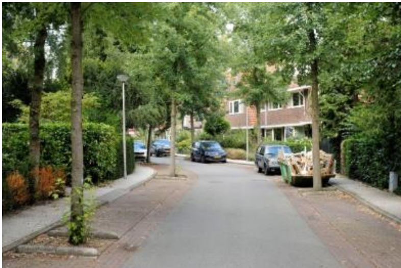
Figuur 3 Van Marnixlaan

Het Bergkwartier is ingedeeld in twee wijken De Berg-zuid en De Berg-noord. De wijk ligt op de Amersfoortse Berg op ca. 44 meter boven NAP. De wijk kenmerkt zich door de grote jaren 30 woningen en het vele groen. Het wordt daarom door velen als een villawijk aangemerkt. In de tweede helft van de 19e eeuw kwam er de eerste bebouwing op de Berg: enkele welgestelde burgers uit Amersfoort bouwden landhuizen buiten de stad op de Berg. Rond de eeuwwisseling van de 19e