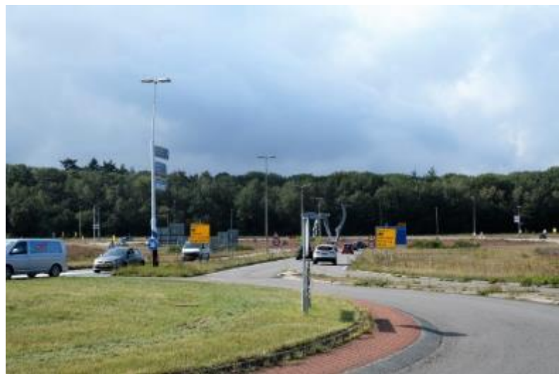
Figuur 5 Stichtse Rotonde

Het Bosgebied ligt op het Oostelijke gedeelte van de stuwwal tussen Amersfoort en Soesterberg. Bosgebied Berg heeft in totaal een oppervlakte van ruim 72 ha en omvat 56,5 ha bos. Het bosgebied bestaat uit de deelgebieden Belgenmonument, Klein Zwitserland, Prins Frederiklaan en Stichtse Rotonde.