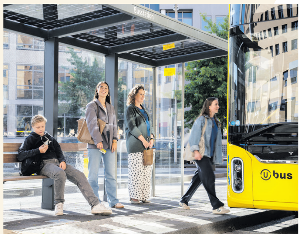
Reis een jaar lang gratis in de provincie Utrecht (foto: Robert Oosterbroek).

Wilt u uw vragen liever per mail stellen? Stuur dan een e-mail naar info@indebuurt033.nl .