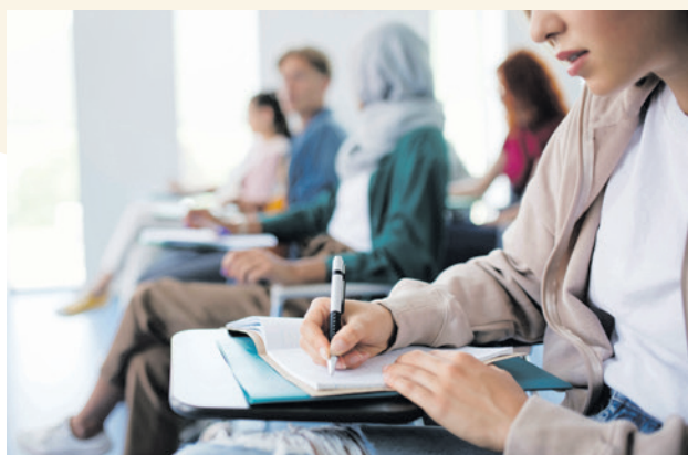
De rekenkamer Amersfoort adviseert onder andere om het taalaanbod uit te breiden zodat meer inburgeraars doorleren.

Sinds 2022 zijn gemeenten verantwoordelijk voor de begeleiding van nieuwkomers. Het gaat bijvoorbeeld om taallessen, ondersteuning bij het vinden van werk en hulp bij het meedoen in de samenleving. In Amersfoort gebeurt dit via de 'Amersfoortse Inburgeringsaanpak'. Integratiewerk voert deze aanpak grotendeels uit. Voor