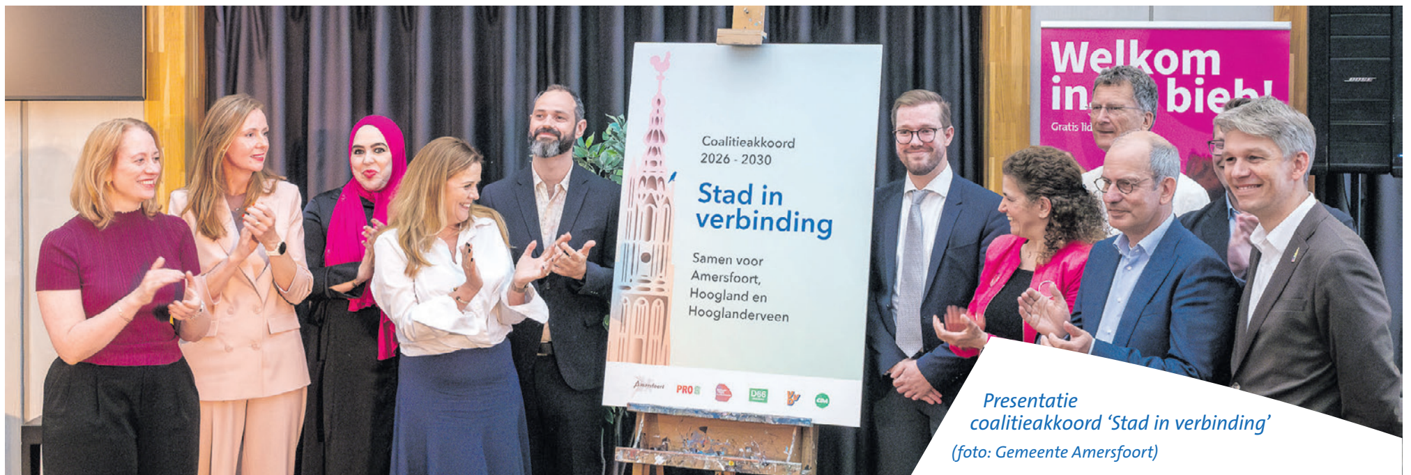
Presentatie coalitieakkoord 'Stad in verbinding'