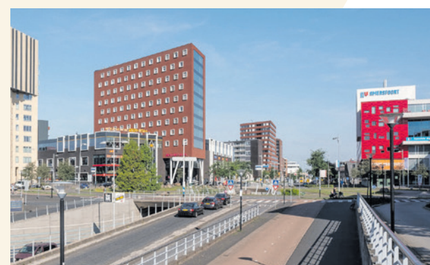
Rotonde De Nieuwe Poort (foto: Gemeente Amersfoort).

Actuele informatie staat op www.amersfoort.nl/denieuwepoort .