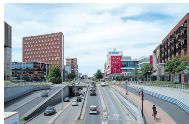
Aanpassingen aan de rotonde moeten zorgen voor meer veiligheid en een betere doorstroming.

Als de raad instemt met het voorstel, werkt het college het ontwerp verder uit. De planning is om in 2027 te starten