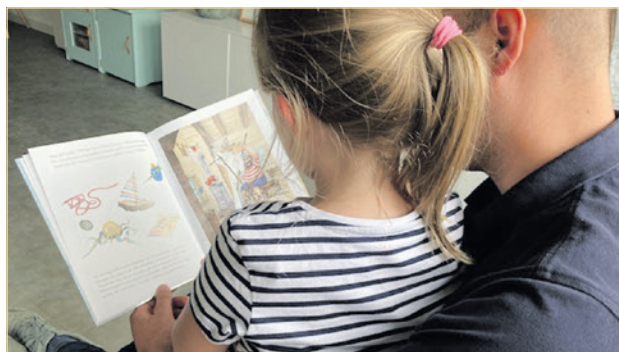
Amersfoort2014 ziet burgervoogdij als een waardevolle vorm van zorg.