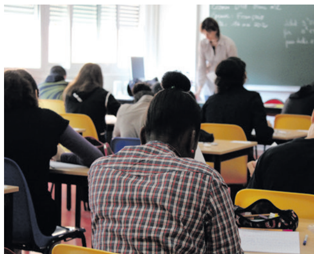
De rekenkamer Amersfoort adviseert onder andere om het taalaanbod uit te breiden zodat meer inburgeraars doorleren.

Sinds 2022 zijn gemeenten verantwoordelijk voor de begeleiding van nieuwkomers. Het gaat bijvoorbeeld om taallessen, hulp bij het vinden van werk en ondersteuning bij het meedoen in de samenleving. In Amersfoort gebeurt dit via de 'Amersfoortse Inburgeringsaanpak'. Integratiewerk voert deze aanpak grotendeels uit. De rekenkamer onderzocht hoe de aanpak in de praktijk werkt. Daarbij keek de rekenkamer naar cijfers en naar de ervaringen van inburgeraars, uitvoerders en beleidsmakers.