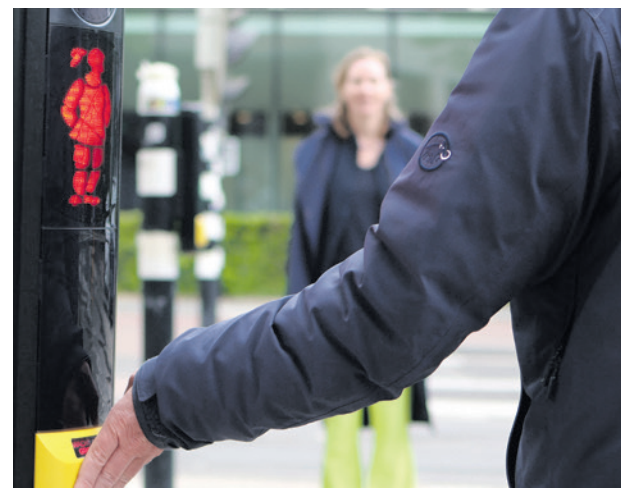
Nieuwe situatie oversteekplaats kruising Stationsplein.

Ook geeft het geluidssignaal bij het voetgangerslicht (de rateltikker) een extra controle, om te voorkomen dat het geluid niet werkt of een verkeerd signaal geeft. Nu is er ook een drukknop met een buzzer. Die geeft licht, geluid én trillingen. Zo krijgt iedereen het oversteeksignaal op een manier die past.