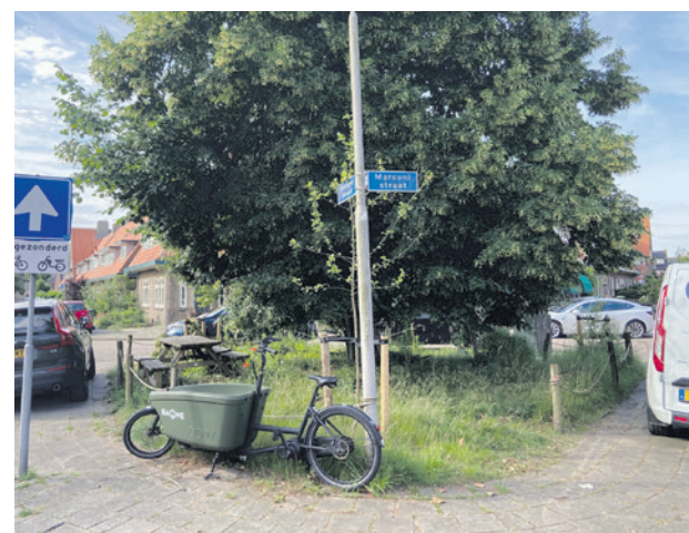
Inwoners van De Driehoek verwachten meer parkeerverlast als er straks ook parkeerregulering geldt in Jericho en Jeruzalem en het Soesterkwartier.

Tijdens de bijeenkomst geven inwoners een presentatie over de overlast die zij ervaren en wat dit betekent in hun dagelijks leven. De commissieleden kunnen vragen stellen en met hen in gesprek gaan. Partij voor de Dieren vindt het belangrijk dat de raad op de hoogte is van de situatie in De Driehoek. Zo kan de raad de ervaringen van de inwoners betrekken bij verdere besluitvorming over het parkeerbeleid.