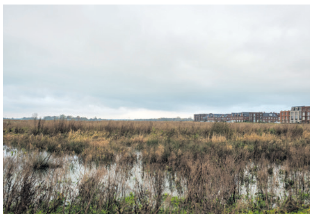
In de nieuwe woonwijk Bovenduist komen ruim drieduizend woningen en voorzieningen.

Het college mag de samenwerkingsovereenkomst zelf sluiten. De gemeenteraad kan vooraf wel wensen en bedenkingen meegeven. Het college stelt de raad voor om dat niet te doen. Dat is omdat het een uitwerking is van de hoofdlijnenovereenkomst die in september 2025 is vastgesteld.