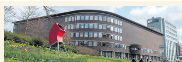
Het college kijkt of Flint, De Lieve Vrouw en FLUOR een nieuwe plek kunnen krijgen op de stadhuislocatie.

Deze agendapunten worden uitgebreid behandeld: 6. Wet Veilige jaarwisseling (peiling - oordeelsvorming) 7. Raadsacademie: Ontwikkeling cultuurpodia op stadhuislocatie (beeldvorming)