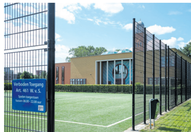
Het college werkt samen met de Amersfoortse moslim-gemeenschap aan een plan van aanpak om moslimdiscriminatie te voorkomen.

Tijdens de bijeenkomst is er aandacht voor mogelijke maatregelen en manieren die helpen om moslimdiscriminatie te bestrijden. Ook wordt besproken hoe