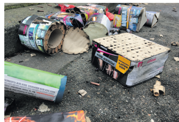
In Amersfoort geldt al enkele jaren een afsteekverbod van vuurwerk.

Het landelijk vuurwerkverbod moet zorgen voor meer veiligheid, minder schade en minder overlast voor mens en dier. In sommige steden is al een verbod van kracht. In Amersfoort geldt sinds enkele jaren een verbod op het afsteken van consumentenvuurwerk. Volgens het college past het niet bij dat beleid om uitzonderingen toe te staan. Veiligheid van mens en dier en luchtvervuiling waren belangrijke argumenten om over te gaan tot dit verbod. Daarnaast zegt het college dat handhaven van de ontheffingen lastig is. Tijdens oud en nieuw heeft de politie het al erg druk en is er weinig tijd om te controleren of mensen zich aan de regels houden. Ook kost het behandelen van aanvragen en bezwaren medewerkers van de gemeente veel tijd.