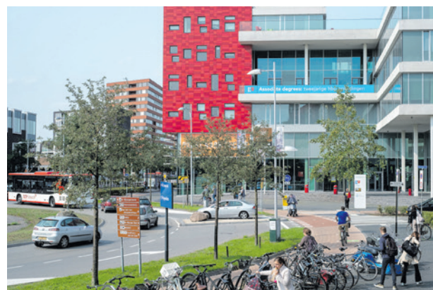
In het nieuwe ontwerp krijgen fietsers en voetgangers niet overal voorrang.

Het college zoekt al enkele jaren naar een oplossing voor deze rotonde. Ook speelt mee dat de omgeving de