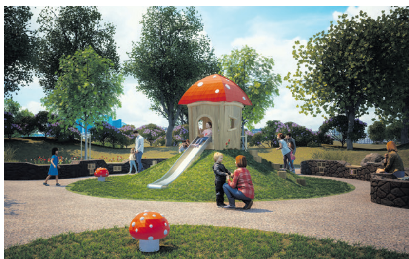
De nieuwe speelplek (ontwerp)

Kijk voor meer informatie over de spelregels op amersfoort.nl/spelregels .