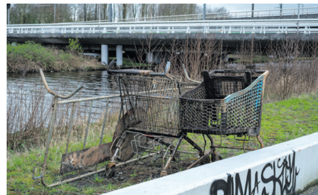
In de nieuwe APV staan regels om het 'zwerfkarrenprobleem' aan te pakken.

Na deze bespreking neemt de gemeenteraad een besluit over de aangepaste APV tijdens een raadsvergadering.