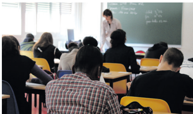
De rekenkamer heeft het rapport 'Inburgering onder één dak - De kracht van de Amersfoortse inburgeringsaanpak' aangeboden aan de raad.

De rekenkamer Amersfoort presenteert haar onderzoek naar de Amersfoortse inburgeringsaanpak. Daaruit blijkt dat Gemeente Amersfoort nieuwkomers op veel punten goed ondersteunt én dat er verbeteringen nodig zijn.