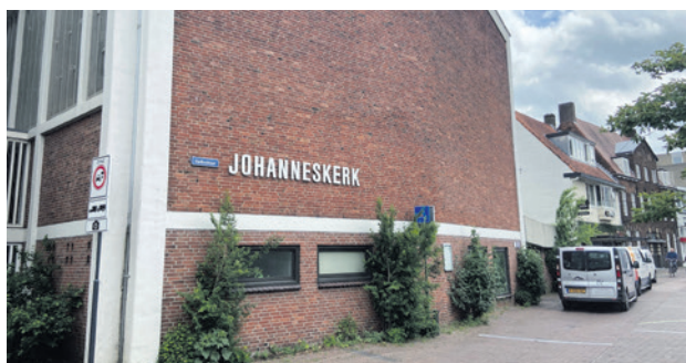
Eind dit jaar stopt de inloop bij de dagbestedingslocatie De Boeier in de Johanneskerk (foto: Gemeente Amersfoort).

De commissie bespreekt de toekomst van de inloop bij dagbestedingslocatie De Boeier. De fractie van KeiHart voor Amersfoort heeft dit onderwerp op de agenda gezet vanwege zorgen bij deelnemers en hun naasten.