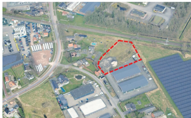
Er zijn plannen voor twee bedrijfshallen aan de Koedijkerweg 6.

De gemeenteraad gaf op 4 oktober 2022 een ontwerpverklaring van geen bedenkingen af. Daarna lagen het plan en de verklaring ter inzage en konden mensen reageren. Op 16 mei 2023 besprak de commissie de reacties. Toen werd