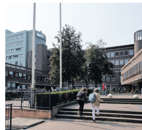
Veel budgetten van de gemeente zijn in 2025 niet gebruikt door vertragingen en personele wisselingen.

De gemeenteraad neemt op 8 juli een besluit over de jaarstukken.