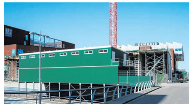
Het Eemplein is onderdeel van Langs Eem en Spoor. Er zijn plannen om in totaal ongeveer 5.500 woningen in dit nieuwe stadsdeel te bouwen.

Voor de volgende fase heeft het college het ontwerp-omgevingsprogramma Langs Eem en Spoor opgesteld, met als titel 'Gezond samenleven in de compacte stad'. Hierin staan de doelen en ambities voor de verdere ontwikkeling van het gebied. Het ontwerpprogramma ligt van 22 juni tot en met 3 augustus ter inzage. Dat betekent dat iedereen erop kan reageren. Het college verwacht dat het ontwerpprogramma in het najaar aan de raad voorgelegd kan worden. Dan kan de raad wensen en bedenkingen meegeven.