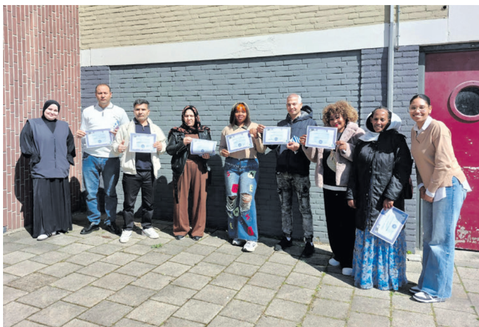
Deelnemers met hun certificaten en studenten zijn blij met de training.

Veteranen uit Amersfoort en Leusden zijn van harte uitgenodigd om deel te nemen aan deze bijzondere dag. Wilt u zich aanmelden of meer informatie over het programma? Kijk dan op: www.amersfoort.nl/veteranendag