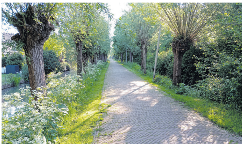
“De Groenesteeg: pad tussen het Waterwingebied en de Groengordel Rustenburg.”