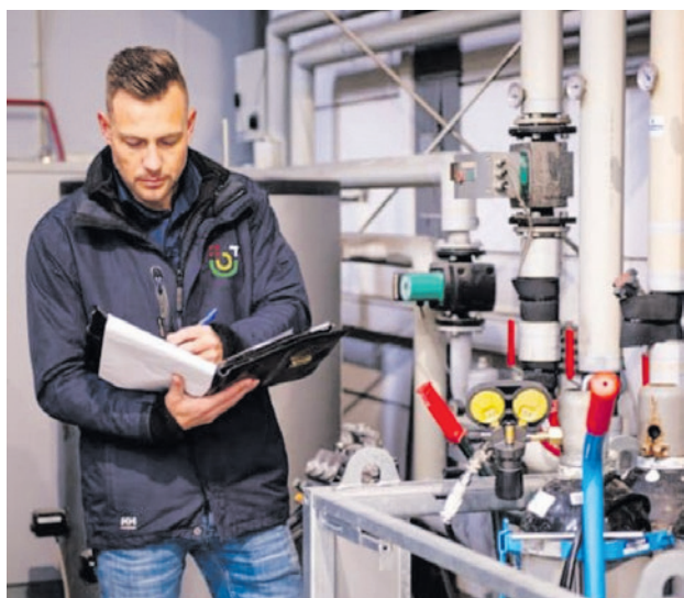
De ODU werkt voor de hele provincie Utrecht en houdt zich bezig met vergunningen, toezicht en handhaving.

De Omgevingsdienst Utrecht (ODU) heeft de ontwerp-begroting voor 2027 opgesteld. De gemeenteraad beslist over het voorstel van het college om een zienswijze (officiële reactie) te geven.