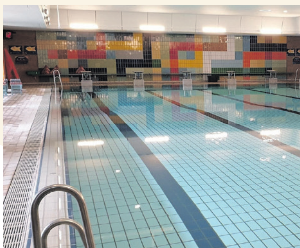
Het huidige zwembad Hoogland wordt vervangen door een nieuw en toekomstbestendig zwembad.

Als de raad instemt, start de volgende fase van het project. Het college werkt het plan dan verder uit en bespreekt het met de klankbordgroep. Daarna legt het college het uitgewerkte plan ter inzage en kan het college het vaststellen.