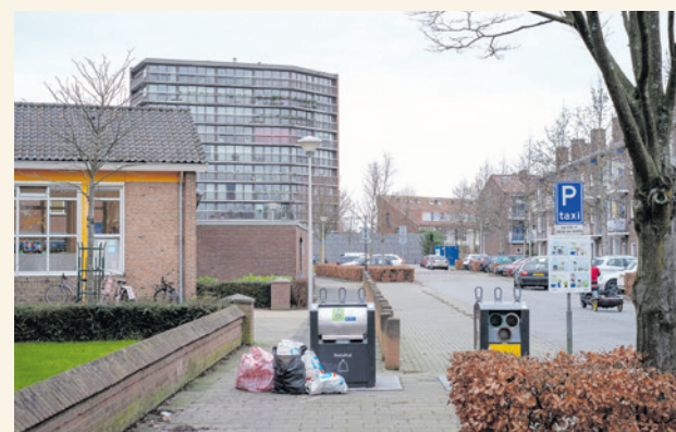
In 2025 was er een gelote burgerraad over het verminderen van afval.

Geerten Boogaard is hoogleraar decentrale overheden en geeft een toelichting op participatie. Hij legt uit wat burgerraden kunnen toevoegen. Daarbij komt aan bod hoe