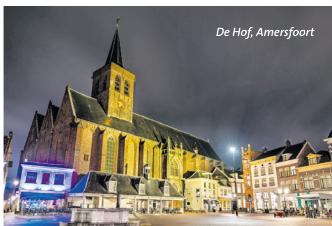
De Hof, Amersfoort