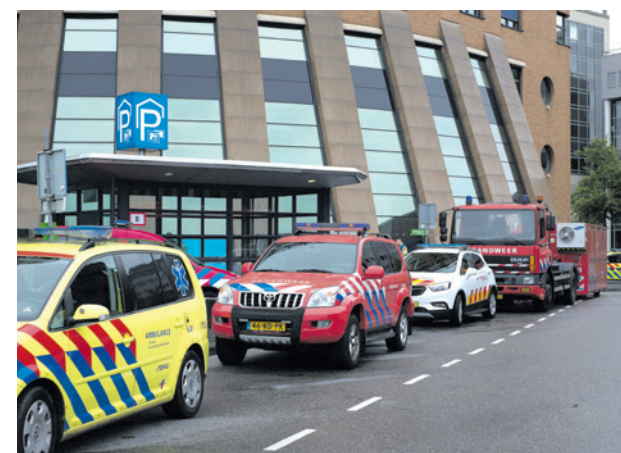
De VRU regelt onder andere brandweezorg en crisisbeheersing in Amersfoort.

De commissie bespreekt dit voorstel. Op 17 juni neemt de gemeenteraad er een besluit over.