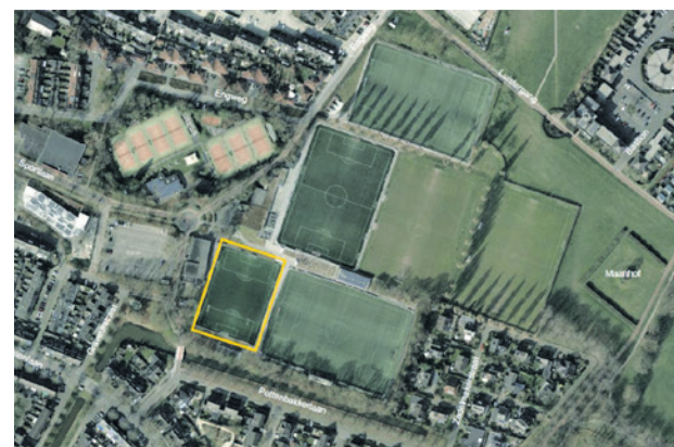
Het nieuwe zwembad Hoogland is bedoeld voor recreatief zwemmen, zwemles en gebruik door verenigingen (beeld: Gemeente Amersfoort).

De gemeenteraad neemt naar verwachting op 17 juni een besluit over de kaders. Als de raad instemt, start de volgende fase van het project. Het college werkt het plan dan verder uit en bespreekt het met de klankbordgroep. Daarna legt het college het uitgewerkte plan ter inzage en kan het college het vaststellen.