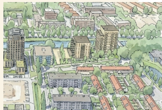
Op de plek van het oude woonzorgcentrum De Liendert aan de Zwaluwenstraat wil Portaal appartementen bouwen. Dit schetsontwerp geeft een beeld van de plannen. Het ontwerp moet nog uitgewerkt worden (bron: Herijking kaders project Zwaluwenstraat).

De commissie bereidt zich nu voor op besluitvorming over het voorstel. Als de raad instemt, kan Portaal het plan verder uitwerken. Daarbij wordt de omgeving opnieuw betrokken.