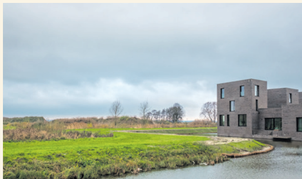
In de nieuwe woonwijk Bovenduist komen ruim drieduizend woningen en voorzieningen.

Met de overeenkomst wil het college een belangrijke stap zetten in de ontwikkeling van Bovenduist. Er komen 3.000 tot 3.300 woningen, met voorzieningen en een bedrijventerpark. Ook wil het college werken aan de ontwikkeling van een groen en recreatief gebied in Over de Laak. Dit extra groen moet voor een deel de woningbouw in Bovenduist compenseren.