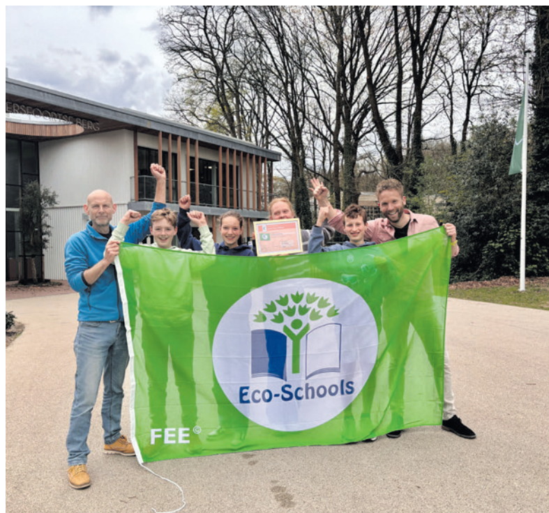
Trots neemt De Amersfoortse Berg de Groene Vlag in ontvangst

Maandag 21 april ontving openbaar lyceum De Amersfoortse Berg officieel de Groene Vlag van Eco-Schools. Daarmee is dit de eerste school in Amersfoort met dit internationale keurmerk voor duurzaamheid.