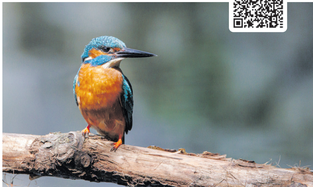
De ijsvogel komt ook voor in het Stadspark Elisabeth Groen

De excursies zijn gratis. Ze starten bij het tuinhuis van Elisabeth Groen en eindigen bij Scouting Cay-Noya. In hun clubhuis houden ze de stand van de zoektocht bij. Hier zijn in de middag ook nog verschillende activiteiten, zoals braakballen van uilen uitpluizen en u kunt beelden van de wildcamera zien.