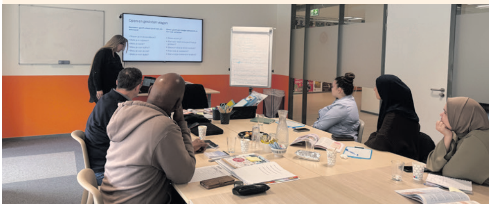
Cursisten verdiepen zich in taal, rekenen en digitaal communiceren.

Wilt u meedoen? Stuur dan een e-mail naar info@professionalsprogramma.nl . Of bel met Michel Wezenberg, 06 48 01 43 65.