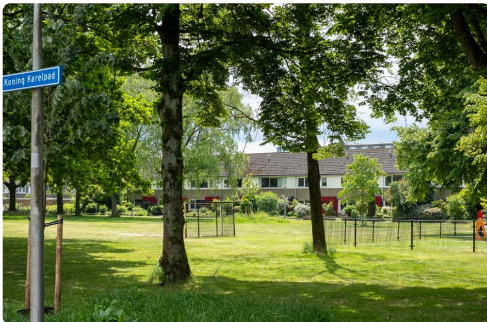
Wijkplan Leefbaarheid Schothorst, Zielhorst en Hoefkwartier

De gemeente Amersfoort, corporaties Portaal en De Alliantie en IndeBuurt033 startten samen een buurtagenda De Plaatsen. Gezamenlijk met bewoners en een groot aantal partners zijn de onderstaande belangrijke thema's en een 16-tal projecten bepaald.