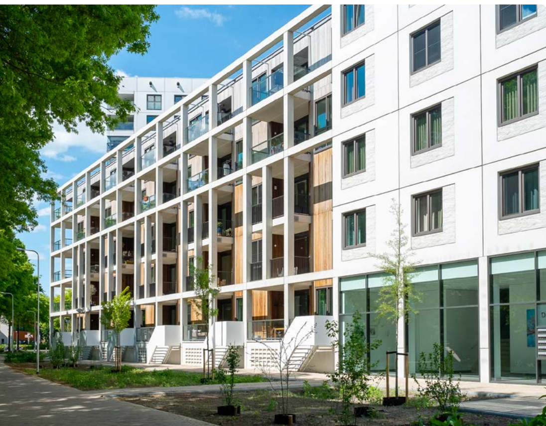
Wijkplan Leefbaarheid Schothorst, Zielhorst en Hoefkwartier

Over een aantal jaar staat hier een nieuwe stadswijk. Maar hoe zorgen we voor een leefbare, veilige, sociale en aantrekkelijke wijk, waar bewoners fijn wonen en verblijven en elkaar kunnen ontmoeten, ook tijdens de 'verbouwing'?