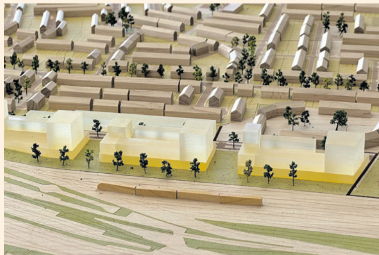
Maquette met appartementen in de Wagenwerkplaats.

maar naar de herinrichting van de Noordewierweg. Sommige mensen raakten in paniek maar nu het bijna klaar is vindt iedereen zijn weg wel weer. Mijn advies is wacht rustig af en trek je eigen plan.”