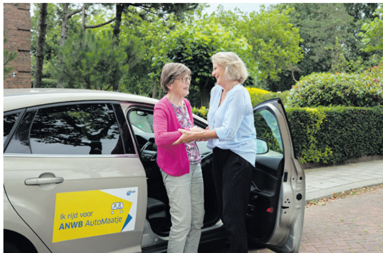
Een chauffeur van AutoMaatje helpt bij uitstappen. (Foto: ANWB)

U kunt ook van maandag tot en met vrijdag tussen 9.00 en 12.00 uur bellen naar: 06 53 70 07 84 of een e-mail sturen. Let op: het e-mailadres is gewijzigd naar: anwb-automaatje@indebuurt033.nl .