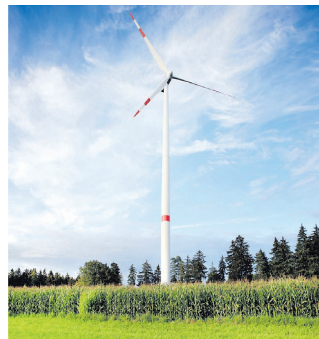
Windwiki wil wetenschappelijke informatie over de gezondheidsrisico's van windturbines delen.

Meer informatie over Windwiki staat op windwiki.nl .