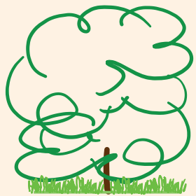
vrij uitgroeivende boom in het groen

De takvrije ruimte boven een voetpad is 4 meter en boven een weg 8 meter. Boven water of groen hoeven we takken in de meeste gevallen niet te verwijderen.