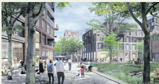
De Woonadviescommissie kijkt mee met de plannen voor de nieuwe woonwijk Hoefkwartier.

De WAC bestaat uit zes leden en een voorzitter die vrijwillig advies geven. Het zijn betrokken Amersfoorters die bijvoorbeeld architect of ergonomist zijn. Andere leden zijn ervaringsdeskundigen op het gebied van toegankelijkheid voor slechtzienden.