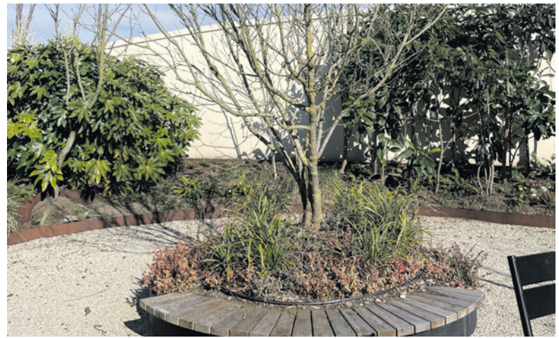
Een voorbeeld van een van de reizende bomen: de Jungle Block.

Groen zorgt voor verkoeling en minder gezondheidsklachten bij hitte. Groen is bovendien een bron van voedsel voor insecten en vogels. Samen kunnen we de biodiversiteit en onze eigen gezondheid verbeteren.