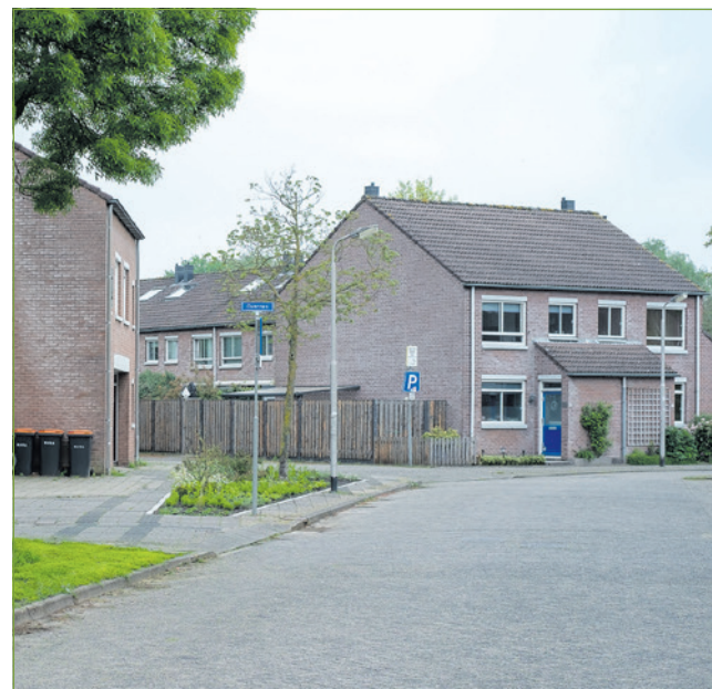
In Amersfoort is vooral een tekort aan 'betaalbare woningen'.