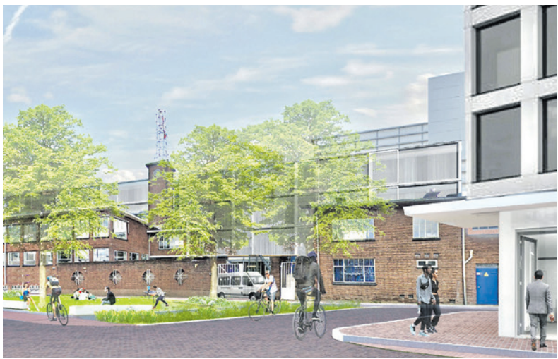
Schets Erdal-gebouw aan de Brabantsestraat.