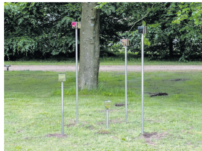
Het monument bestaat uit 360 lichtobjecten. Elk object staat symbool voor een slachtoffer.

Het monument heet Licht van Herinnering en bestaat uit 360 lichtobjecten. Elk lichtobject staat symbool voor een van de Amersfoortse mannen, vrouwen en kinderen die slachtoffer werden van de bezetting. Een lichtobject bestaat uit een pilaar met aan de bovenkant een spiegellende kubus van tien bij tien centimeter. Voor ieder slachtoffer brandt op de datum van overlijden en de avond ervoor een licht.