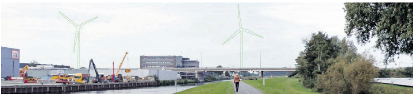
Het college wil alleen verder met het plan voor twee windturbines op Isselt als de nieuwe landelijke regels worden gevolgd.

Meer informatie over Wind op Isselt staat op amersfoort.nl/wind-op-isselt .