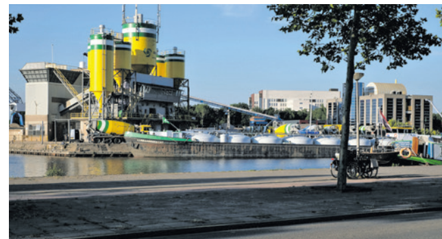
Het havengebied (Nijverheidsweg-Noord) op Isselt. Op dit bedrijventerrein wil het college twee windturbines plaatsen.