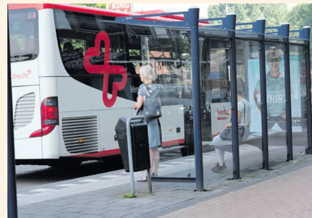
Door de nieuwe plannen gaan er ook meer bussen rijden in de stad (foto: Simon Lamme).

verbeteringen gepland en wat het openbaar vervoer betreft, komt er vanaf december 2025 een uitbreiding van de dienstregeling. Deelvervoer moet aanwezig zijn als alternatief, ook al zijn eerdere projecten niet altijd succesvol geweest. Bijlholt gaf aan dat gefaseerde invoering van vergunningparkeren start waar nu de meeste overlast is. Hij erkende dat deelmobiliteit nog verder moet groeien. Hij benadrukte dat het beleid niet is bedoeld om automobilisten te pesten, maar om ruimte te creëren voor een leefbare stad.