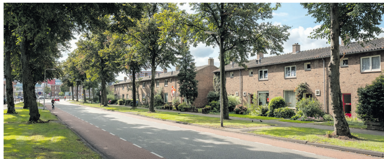
Met een motie (aangenomen) vroegen Amersfoort voor Vrijheid en SP om een gelijktijdige invoering van betaald parkeren in de buurten Jeruzalem, Jericho en Gildekwardier.

Resultaat: Het college moet meer doen om alternatieven voor de auto aantrekkelijker te maken, zoals fietsen, lopen of het openbaar vervoer. En daar moet goed op worden gecontroleerd.