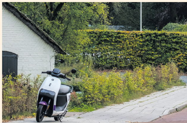
Deelvoertuig zal in de toekomst een belangrijke plek innemen.

Er kwamen 460 reacties van inwoners op het ontwerp-Omgevingsprogramma Mobiliteit; die gingen vooral over parkeren. Sommige mensen maakten zich zorgen over ouderen, mensen met weinig geld of drukte in de wijk. Het college heeft naar aanleiding van deze reacties aanpassingen gemaakt in het beleid.