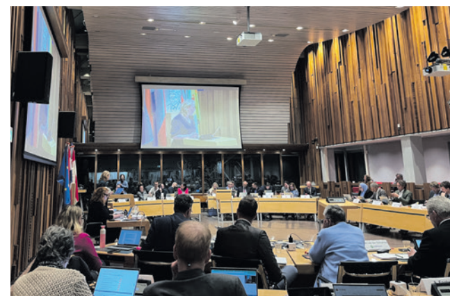
De Amersfoortse raad zal vanaf de nieuwe raadsperiode in 2026 niet meer op dinsdag maar op woensdag vergaderen.