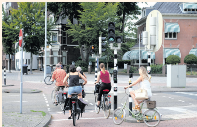
Amersfoort gaat meer ruimte maken voor fietsers en voetgangers.

In het Omgevingsprogramma Mobiliteit staat dat de stad klaar wil zijn voor de toekomst. Het college wil onder andere dat er meer ruimte voor fietsers en voetgangers komt, dat het verkeer veiliger wordt (vooral voor kinderen), dat de lucht schoner wordt en dat nieuwe wijken minder parkeerplekken krijgen. Zo zou iedereen zich in 2035 makkelijk door de stad moeten kunnen bewegen zonder eigen auto. Met veilige fietsroutes, schone bussen, deelauto's en rustige straten. Elke twee jaar komt er een evaluatie. Dan kijkt de gemeenteraad of de doelen worden gehaald: minder uitstoot, meer fietsgebruik, minder ongelukken en meer tevredenheid bij bewoners.