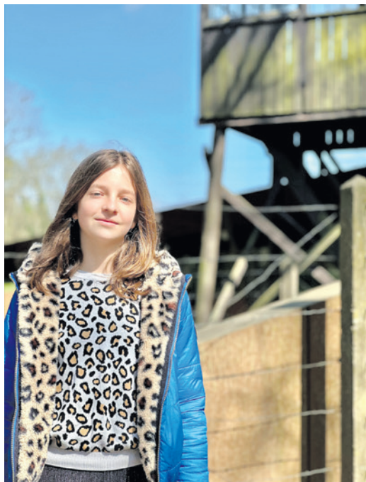
Isis bij Kamp Amersfoort.

best zielig wat haar is overkomen. Ze had niets verkeerd gedaan. Ik vind dat dit nooit meer mag gebeuren."