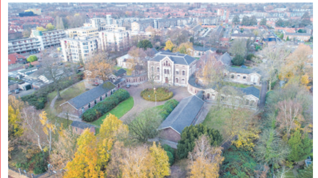
Op het terrein van het Militair Hospitaal komen ongeveer 89 woningen.

Het raadsvoorstel werd unaniem aangenomen.