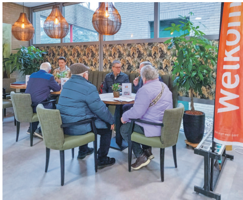
Inloophmoment aardgasvrij Schothorst-Zuid

In Schothorst-Zuid werken we aan een toekomst zonder aardgas. Medewerkers van de gemeente staan klaar om vragen van bewoners te beantwoorden tijdens twee wekelijkse inloophmomenten. Na een succesvolle eerste maand gaat dit ook in april en daarna door.