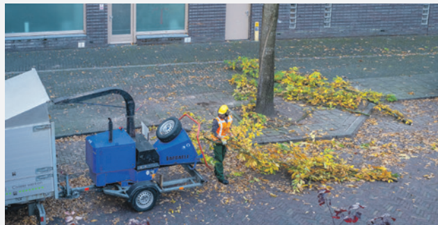
De gemeente zorgt voor het onderhoud van groen in de openbare ruimte.

Wat gebeurt er met de veiligheid als er minder aan groenonderhoud wordt gedaan? Op verzoek van de fractie van D66 is dit onderwerp van gesprek.