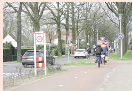
Screenshot uit een reportage van RTV Utrecht over de situatie aan de Hamseweg.

Wethouder Tyas Bijlholt reageerde dat de situatie aan de normen voldoet. Ook gaf hij aan dat al was toegezegd dat de invoegstrook binnenkort duidelijker zou worden gemaakt. “Ik betreur het dat deze motie voorligt, terwijl dit in de commissie is besproken.” Hij ontraadde de motie, omdat deze “het probleem niet oplost, maar verschuift.”