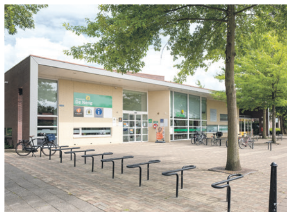
De Neng is het dorps huis van Hoogland.

De commissie wordt bijgepraat over een aantal ontwikkelingen op het gebied van wijkontmoetingsplekken en wijkprogrammering.