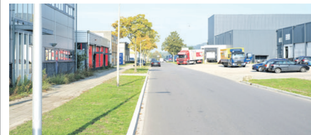
Een voorbeeld van een bedrijventerrein in Amersfoort is Isselt.

Er blijkt behoefte te zijn aan meer ruimte voor werken en zogenoemde schuifruimte. Schuifruimte is ruimte waar bedrijven zich naartoe kunnen verplaatsen omdat deze beter passend is. Dit zorgt voor een verbetering van de bedrijventerreinen.