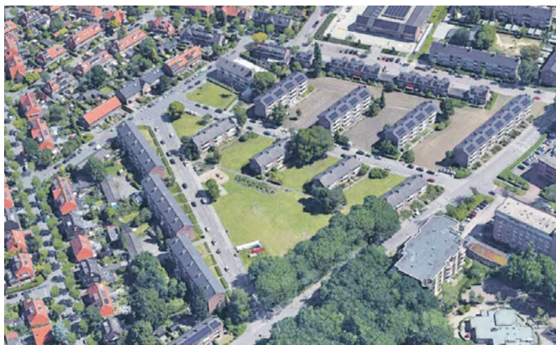
De huidige situatie driehoek Bosweg, Réaumurstraat en Kelvinstraat.

In juli 2023 nam de raad het uitwerkingsvoorstel aan voor de ontwikkeling van de driehoek. Toen sprak de raad over het aantal parkeerplaatsen. Met een motie werd gevraagd om te bekijken hoe er minder parkeerplaatsen op het maaiveld konden komen. De raad nam deze motie aan.