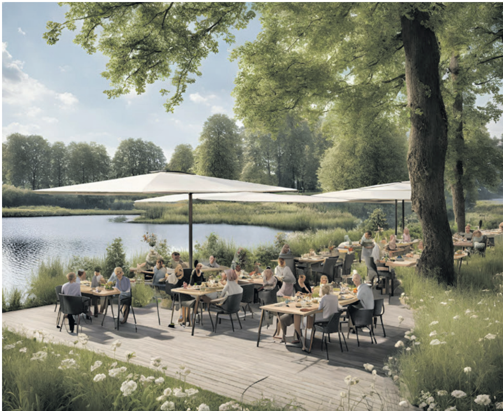
Horecaterras in 't Hammetje (artist impression)