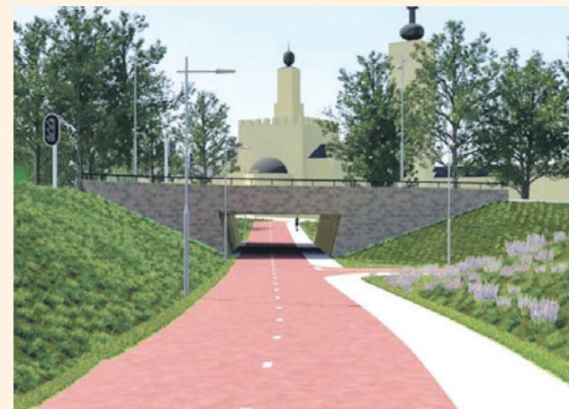
Een voorbeeld van hoe de fietstunnel onder de Daam Fockemalaan bij Leerhotel Het Klooster eruit zou kunnen zien.

Als de gemeenteraad groen licht geeft voor de plannen, gaat het college aan de slag met de deelprojecten. Per project komt het college terug bij de raad met voorstellen voor de verdere uitwerking. Meer informatie staat op amersfoort.nl/fiets-veilig-westzijde-amersfoort.