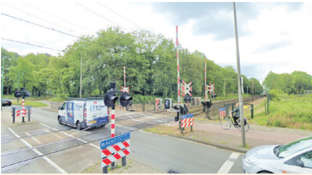
Onderdeel van de Westelijke ontsluiting was dat auto's onder het spoor van de Barchman Wuytierslaan zouden doorrijden.