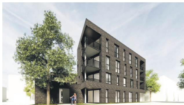
Zo zouden de appartementen aan de Sextant eruit kunnen gaan zien.

Er zijn plannen om elf appartementen te bouwen aan de Sextant 1 in de wijk De Koppel. Deze komen in de plaats van de garageboxen die er nu staan. Het college vraagt de gemeenteraad een zogenaemde verklaring van geen bedenkingen af te geven. Hiermee geeft de raad aan geen bezwaar te hebben tegen de plannen.