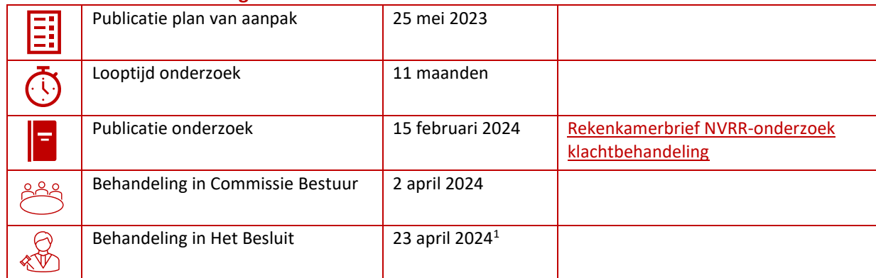
Tabel 3 Klachtbehandeling