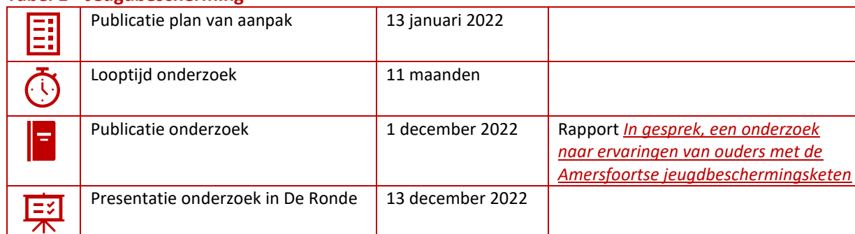
Tabel 1 Jeugdbescherming

Uit het onderzoek blijkt ook dat ouders behoefte hebben aan iemand die hun perspectief kan verwoorden, die voor de rechten van ouders en kind opkomt en die hen kan ondersteunen bij knelpunten. De rekenkamer stelt vast dat de mogelijkheid om een onafhankelijk cliëntondersteuner in te schakelen, onvoldoende bekend lijkt. Daarnaast zouden ouders die ervaring met jeugdbescherming hebben, ingezet kunnen worden bij verbetering van de jeugdbeschermingsketen. Zij hebben zicht op wat er mis gaat en hebben ook waardevolle inzichten voor verbetering.