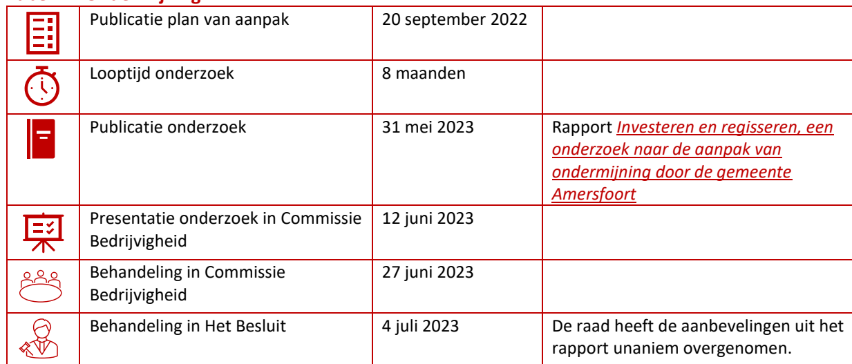
Tabel 2 Ondermijning

informereren over de aard en omvang van ondermijning en op basis daarvan te bepalen welke accenten er in het beleid moeten zitten.