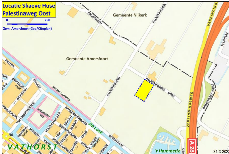
Afbeelding 2 Omgeving Palestinaweg Oost

Het terrein ligt aan de Palestinaweg Oost binnen het gebied Over de Laak dat we groen en recreatief gaan inrichten. Over de Laak grenst aan de woonwijk Vathorst-Noord en aan de gemeente Nijkerk. Het perceel bevindt zich aan de Palestinaweg Oost 3-5: het gedeelte aan de zuidkant van de weg, waar voorheen de stal van de voormalige boerderij stond. Er komt geen Skaeve Huse op het noordelijk perceel. Op het zuidelijk perceel is het mogelijk om de woonunits op verschillende manieren te plaatsen. Dit wordt in de uitwerkingsfase verder uitgewerkt. De locatie is in eigendom van Omnia Wonen.