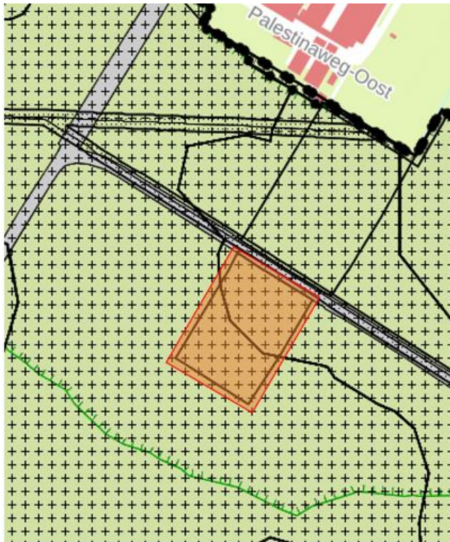
Afbeelding 4 Bestemmingsplan Palestinaweg Oost

De locatie kent op dit moment de bestemming ‘agrarisch met waarden - slagenlandschap met perceel begroeiing’. Dit betekent dat het perceel is bestemd voor een boerenbedrijf met bescherming van het landschap met landbouwpercelen in stroken (slagen), de natuur en eventuele cultuurhistorische elementen. Op het zuidelijk perceel (locatie Skaeve Huse) stond een voormalige stal, die bij de boerderij met schuren op het noordelijke perceel hoorde. Deze gebouwen zijn in eigendom van Omnia Wonen en inmiddels om veiligheidsredenen gesloopt, omdat de gebouwen dreigden in te storten.