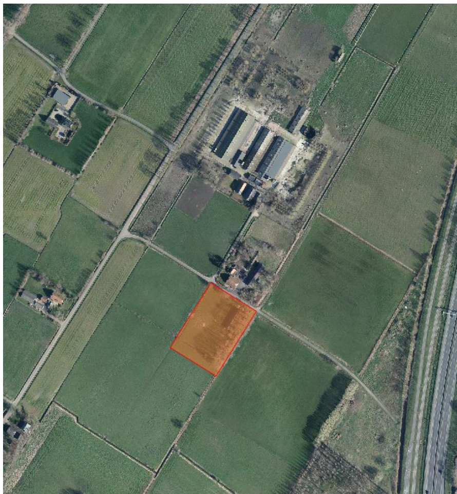
Afbeelding 1 Palestinaweg Oost 3-5