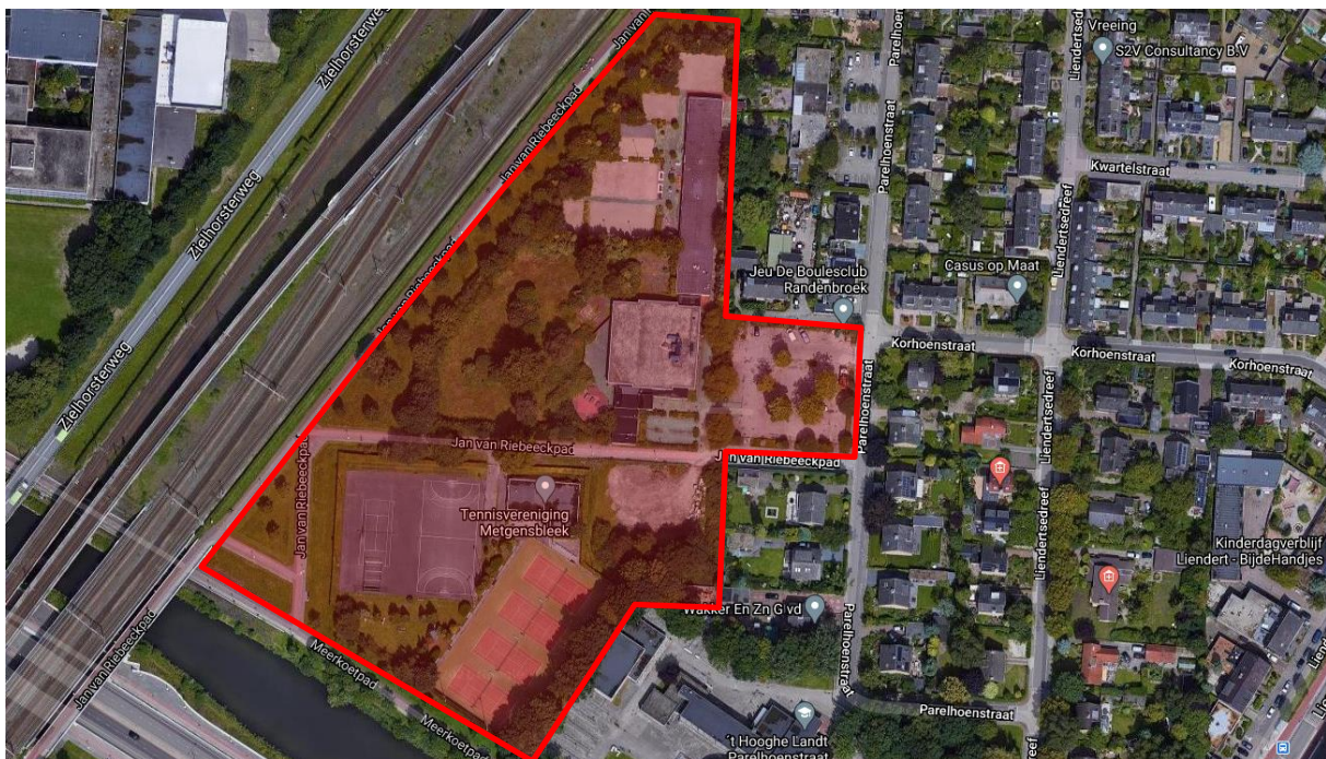
figuur 1: projectgebied, plan- en onderzoeksgebied, bron: google maps 2021

Onderstaand is de luchtfoto van het plangebied weergegeven.