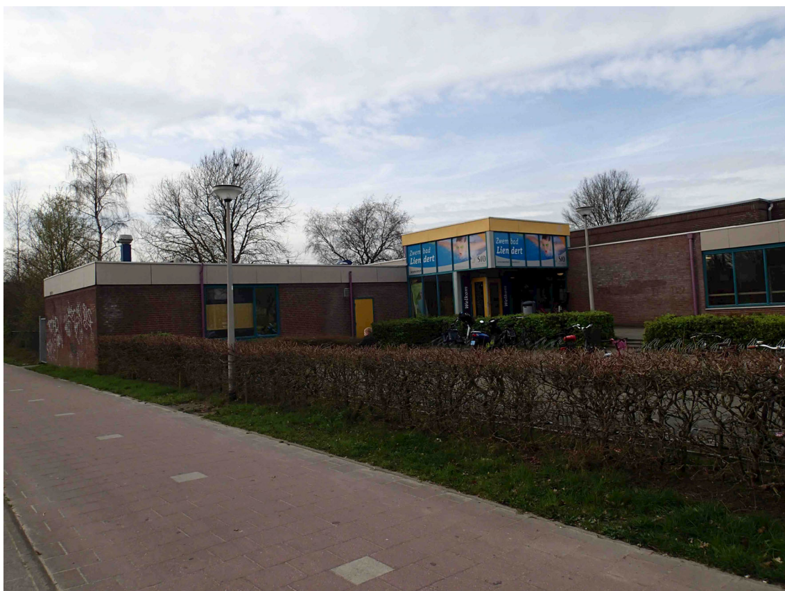
Figuur 2. Zwembad Liendert.

In het plangebied zijn geen beschermde soorten planten aangetroffen. Geschikte groeiplaatsen zijn niet aanwezig. Op grond hiervan is beoordeeld dat het plangebied geen betekenis heeft voor beschermde soorten planten.