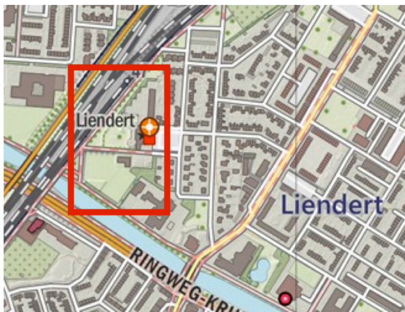
Figuur 1 Ligging plangebied (rood omcirkeld, ondergrond: Data by OpenTopo.nl).