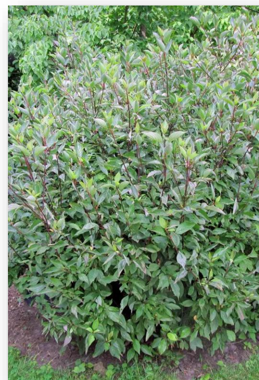
Cornus alba 'Kesselringi' (witte kornoelje)