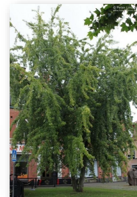
Ac.s.BG. – Acer saccharinum 'Bonn's Gracious' (suikeresdoorn)