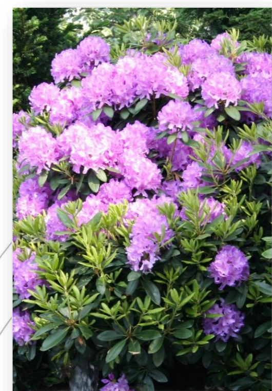
Rh.CB – Rhododendron 'Catawbiense Boursault'