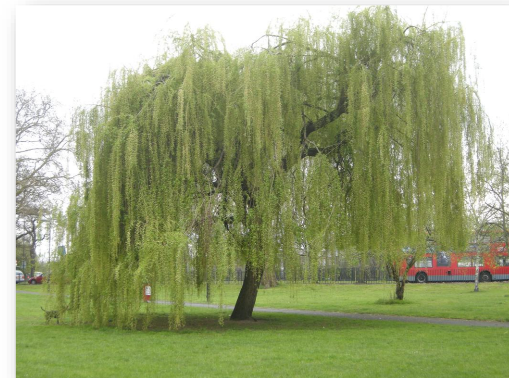
Sa.b.P. – Salix babylonica 'Pendula' (Chinese treurwilg)