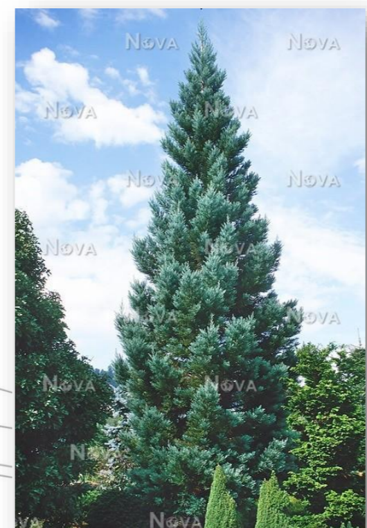
Se.s.G. – Sequoia sempervirens 'Glauca' (mammoetboom)