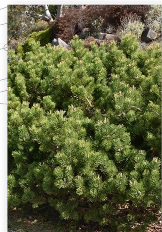
Pl.m. Pinus mugo var. mughus (dwergden)