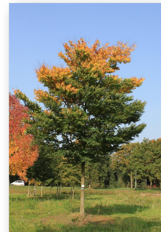
Ze.UR. – Zelkova 'Urban Ruby' (Japane schijnep)