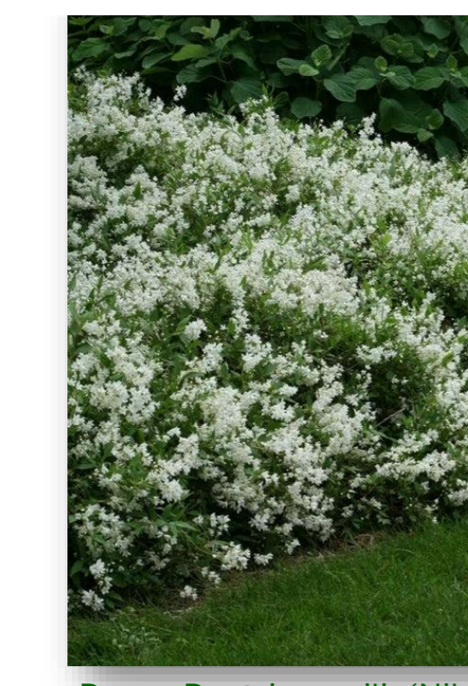
De.g. – Deutzia gracilis 'Nikko' (bruidsboom)