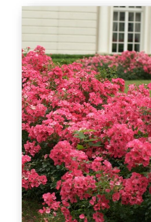
Ro.s. – Rosa 'Stad Rome' (heesterros)