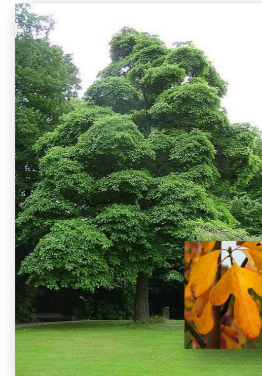
Ss.al. – Sassafras albidum (sassafras)