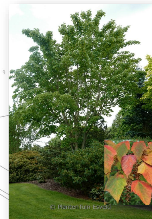
Ac.cp. – Acer capillipes (streepjesbast esdoorn)