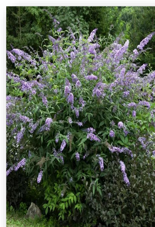
Bu.d. – Buddlejia davidii 'Dart's Purple Rain' (vlinderstruik)