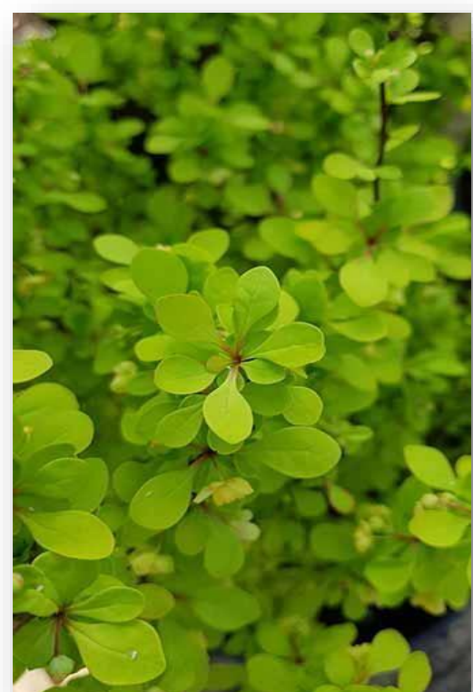
Be.t. – Berberis thunbergii 'Dart's Defiance' (zuurbes)