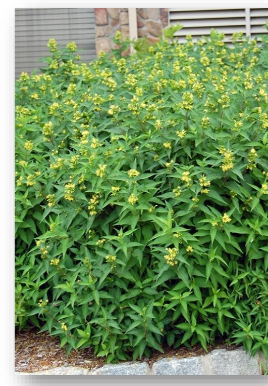
Di.s. – Diervilla sessifolia 'Butterfly' (boskamperfoelie)