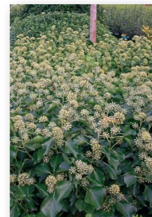
He.h. – Hedera helix 'Arborescens' (struikklimop)