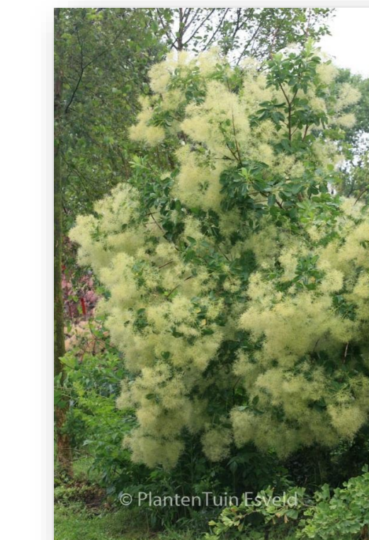
Cotinus coggygria (pruikenboom)