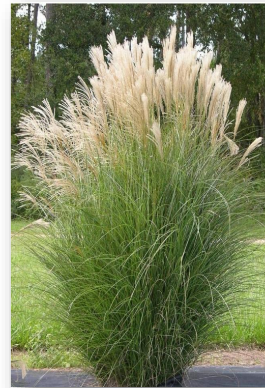
Mi.s. – Miscanthus sinensis 'Gracillimus' (Chinees riet)