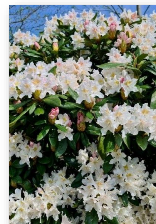
Rh.CW – Rhododendron 'Cunningham's White'