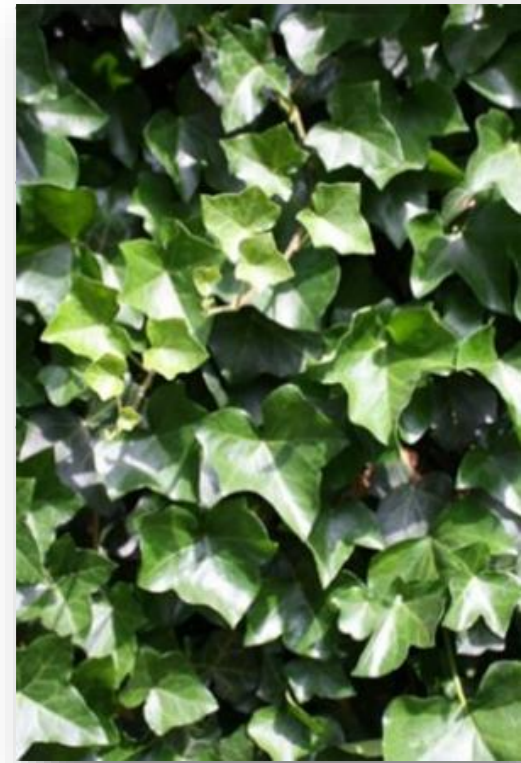
Hedera hibernica (klimop)