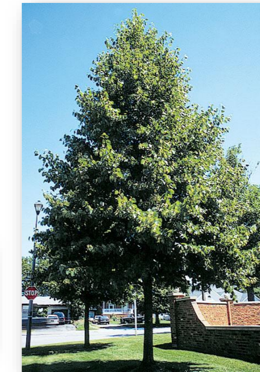
Ti.a.R. – Tilia americana 'Redmond' (Amerikaanse linde)