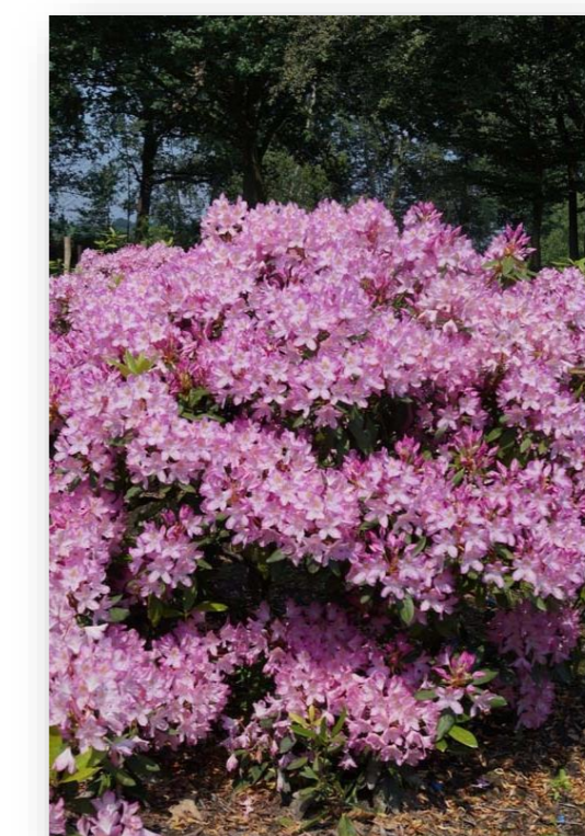
Rh.P. – Rhododendron 'Ponicum Roseum'