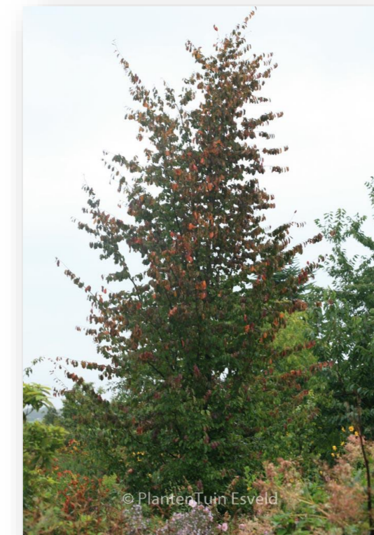
Pa.p.V. – Parrotia persica 'Vanessa' (Perzisch ijerhout)