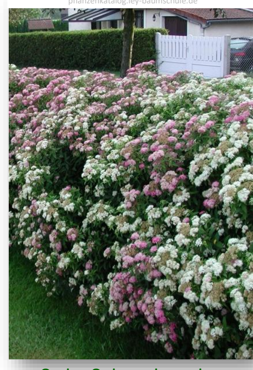
Sp.j. – Spiraea japonica 'Genpei' (spierstruik)